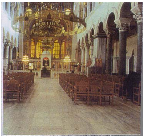
Εσωτερικό του ναού του Αγίου Δημητρίου

Σύμφωνα με κάποιες πηγές, πρωτοχτίστηκε πάνω από ένα ρωμαϊκό λουτρό στο οποίο μαρτύρησε ο άγιος το 303. Σύμφωνα με την παράδοση, από το σημείο όπου μαρτύρησε ο άγιος άρχισε να αναβλύζει μύρο. Το 324 που ορίστηκε ο χριστιανισμός σαν επίσημη θρησκεία του κράτους οι Θεσσαλονικείς οικοδόμησαν ένα μικρό τρίκλιτο ναό στο σημείο αυτό. Η φήμη του ναού αυτού σύντομα εξαπλώθηκε σε όλο τον χριστιανικό κόσμο διότι αποδείχτηκε ότι το μύρο είχε ιαματικές ιδιότητες. Προσκυνητές κατέφταναν από όλα τα μέρη του κόσμου για να προσευχηθούν και να θεραπευτούν. Ανάμεσα σε αυτούς προσήλθε και ο έπαρχος του Ιλλυρικού, Λεόντιος. Ο Λεόντιος θεραπεύτηκε από κάποια ανίατη ασθένεια που τον ταλάνιζε και σε ένδειξη ευγνωμοσύνης προς τον Άγιο, αντικατέστησε το μικρό τρίκλιτο ναό με μια επιβλητική Βασιλική το 413. Η Βασιλική στεκόταν εκεί μέχρι και τα χρόνια του αυτοκράτορα Ηρακλείου (610-641) όταν καταστράφηκε από φωτιά.