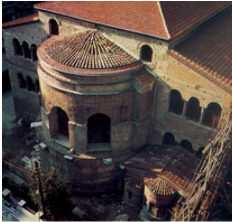
Η κόγχη του ιερού του ναού της Αχειροποιήτου Θεσσαλονίκης. Διακρίνονται (δεξιά, αριστερά) τα "τρίλοβα" παράθυρα και το μικρό παρεκκλήσι σε επαφή με το ιερό.

Το πότε κτίστηκε ο ναός δεν έχει προσδιοριστεί με ακρίβεια. Η άποψη που επικρατεί είναι ότι κτίστηκε αμέσως μετά την Γ' Οικουμενική Σύνοδο της Εφέσου του 431, οπότε καταδικάστηκε ο αιρετικός Νεστόριος που δίδασκε ότι η Παναγία δεν είναι "Θεοτόκος" αλλά απλά "Χριστοτόκος". Μετά την εξέλιξη αυτή κτίστηκαν σε ολόκληρη την αυτοκρατορία πολλοί ναοί προς τιμή της Θεοτόκου και -κατά πάσα πιθανότητα- και αυτός της Αχειροποιήτου Θεσσαλονίκης με την ονομασία: "Ναός της Παρθένου και Θεοτόκου της Αχειροποιήτου και Οδηγητριάς". Κατά την παράδοση το όνομα "Αχειροποίητος" δόθηκε στο ναό από μία εικόνα της Θεοτόκου που δεν πλάστηκε από ανθρώπινα χέρια (α-χειροποίητος), αλλά έπεσε από τον ουρανό. Μάλιστα υποστηρίχθηκε από τους βυζαντινούς συγγραφείς ότι η εικόνα αυτή ήταν ισάξια με τις περίφημες "αχειροποίητες" εικόνες του "Αγίου Μανδηλιού" και του "Αγίου Κεραμίου".