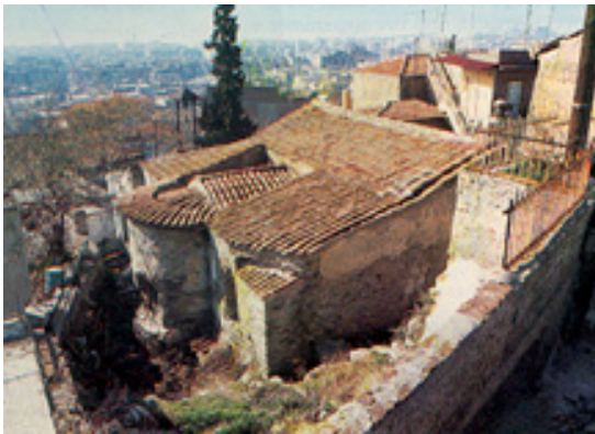
Ανατολική όψη (κόγχη ιερού) του ναού του Οσίου Δαβίδ Θεσσαλονίκης

Πέρα από το αρχιτεκτονικό ενδιαφέρον που παρουσιάζει το μνημείο και το περίφημο ψηφιδωτό του, στο ναό του Οσίου Δαβίδ υπάρχουν σημαντικές τοιχογραφίες του 12ου αιώνα, που αποτελούν σπουδαία και χαρακτηριστικά δείγματα της αγιογραφίας που γνώρισε ιδιαίτερη άνθηση στη βυζαντινή Θεσσαλονίκη.